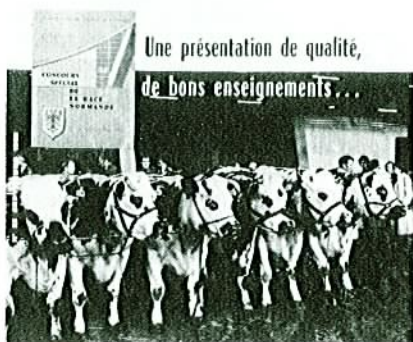
Une présentation de qualité, de bons enseignements...