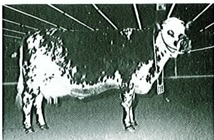
LISBONNE (URAT) appartenant au GAEC du PARQUET (Orne) Championne du Concours de PARIS 1984

Moyenne des 5 lactations : 7497 kg de lait brut à 42,24 de TB et 35,7 de TP, soit 8343 kg de lait standard.