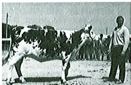
ALEZANE (NUEZ/JAPET/AMER) Championne de NIORT 1987 Contrôlée à 9 jours à 34,8 kg Fille de SAVANE indexée à + 86kg de MU Meilleure lactation à 4 ans 2 mois 12 036 kg de lait à 44 de TB et 31,7 de TP ALEZANE appartient à Jacques MARCHAND du PIN 79.