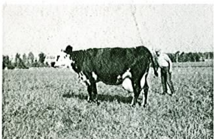
MASCOTTE est une fille de Uberti. Elle appartient à l'élevage MICHEL de Ploubalay (voir en page intérieure). Elle est la première à passer 7 000 kg de MU.