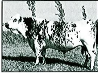
DAIMLER au CIA Crêhen