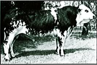
DIACRE à l'URCECOF