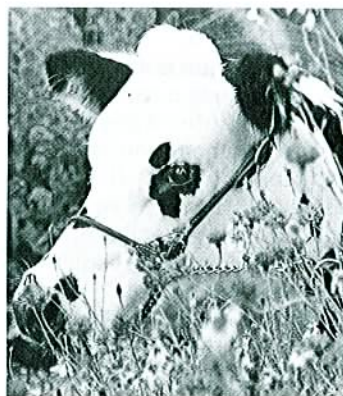
PRENEZ NOTE : le Concours National Normand 1998