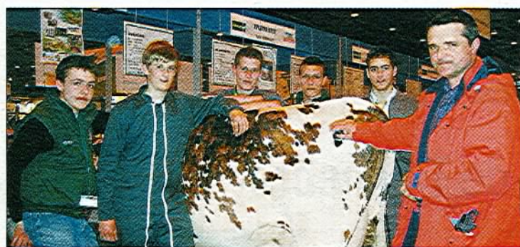
Petite pause autour de Bécacine avant d'entrer sur le ring.

Après avoir réalisé une affiche présentant l'établissement et un blog avant de partir, ces cinq élèves ont veillé au bien être des animaux et au bon déroulement de la traite sur le salon. Chaque matin, ils ont conduit leurs deux vaches sur l'aire de toilettage comme tous les éleveurs présents au salon pour que leurs animaux soient irréprochables au niveau de la présentation. Dimanche matin, ils ont présenté les deux vaches sur le ring central avec