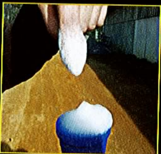
2-Pré-moussage au Biofoam (a. lactique).