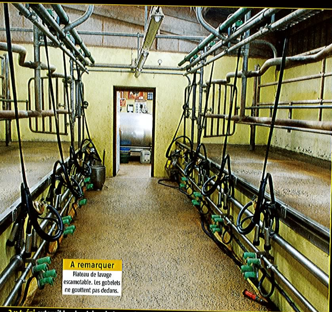
A remarquer Plateau de lavage escamotable. Les gobelets ne gouttent pas dedans.