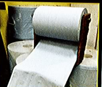
3-Essuyage papier, avant de brancher. Papier « Softcel » Delaval, gaufré, double épaisseur.