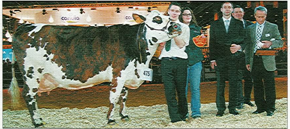
“Rilera”, une fille d'Idris, appartenant au Gaec Duquesne (Manche) emporte pour la seconde fois le prix de Grande Championne.

- Meilleure bouchère : “Ultra”, Ferme de Playe, Aywaille, (Belgique).