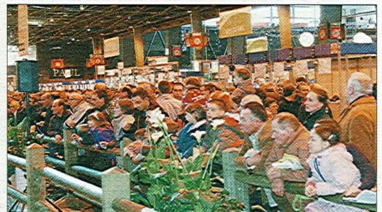
Beaucoup de monde vendredi dernier autour du grand ring pendant les trois heures du concours normand.