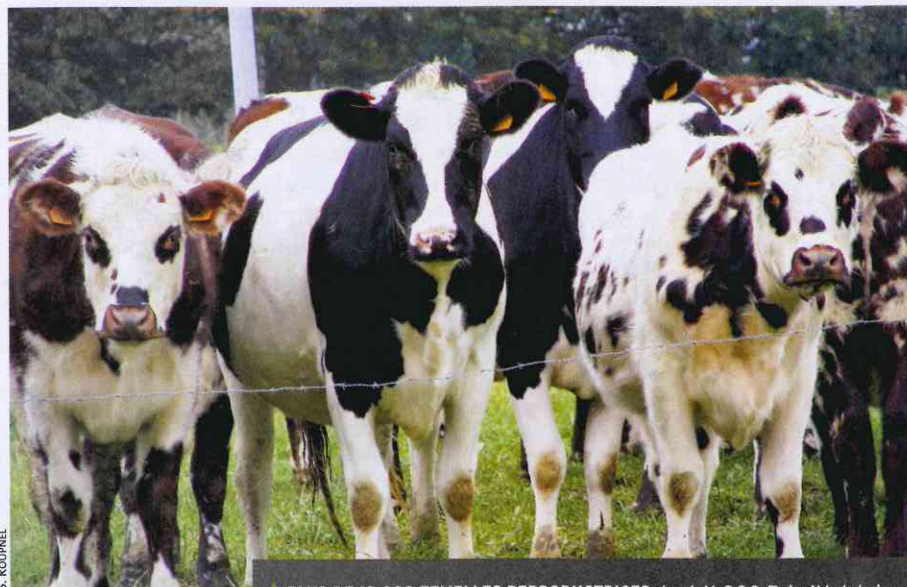
▲ PLUS DE 12 000 FEMELLES REPRODUCTRICES dont 11 000 Prim'Holstein et 1 000 Normandes sont actuellement mises sur le marché par les deux coopératives désormais unies.

Fruit du regroupement d'Ouest Génisses et de Génis'Bretagne, Ouest Génis' veut commercialiser 15 000 génisses par an d'ici trois ans.