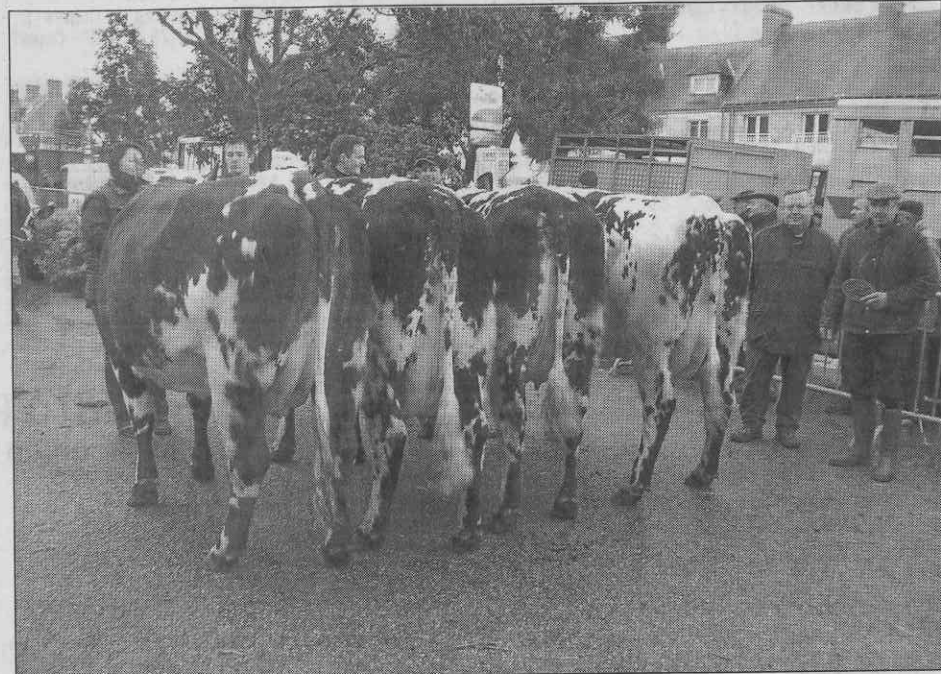
Vendredi, la place Albert Pélerin accueillera de magnifiques vaches Normandes pour une nouvelle édition de la Chandeleur.