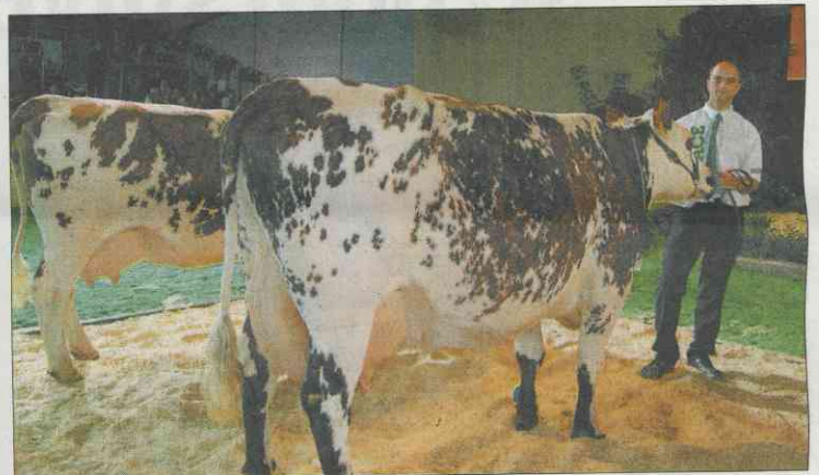
"Sardine" (Gaec Cahorel, Manche) remporte le prix de la meilleure fromagère.

La championne Jeune porte un nom prédestiné puisqu'elle s'appelle justement "Championne" et vient aussi de Bretagne. Quant à la championne adulte