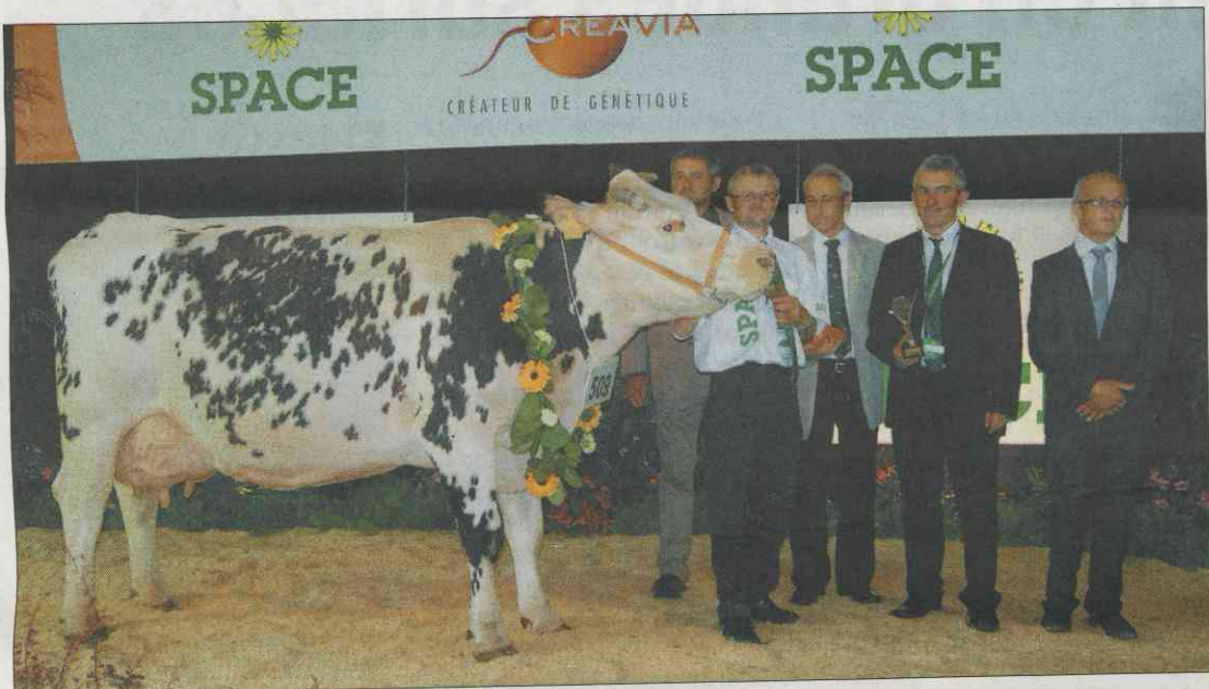
«Urne» (Ninas X Indiscute), Championne Space 2010.

Six sections étaient en lice pour cet inter-régional de la race Normande, mardi au Space. Des sections homogènes présentant dans les femelles en 4 e , 5 e lactations et plus des gabarits imposants. La différence s'est effectuée sur les plus beaux ensembles : DPJ, mamel-