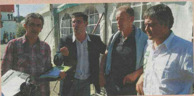
Les dirigeants de PMS voudraient aussi que l'OS Normande s'implique plus dans les contrats proposés aux éleveurs.