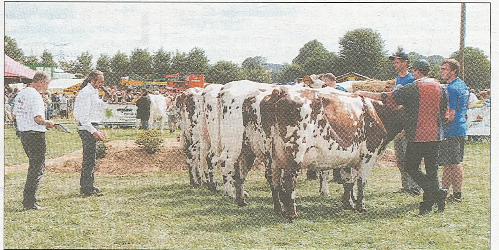
Le Comice Agricole du Coglais s'est tenu cette année au sein de la Fête de l'agriculture.