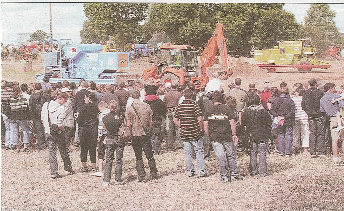
Le Moiss'Batt Cross attire toujours la foule.