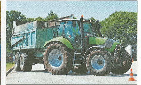
Une filière agroéquipement qui recrute et qui bénéficie d'un partenariat très actif avec un tractoriste bien implanté dans l'Orne.