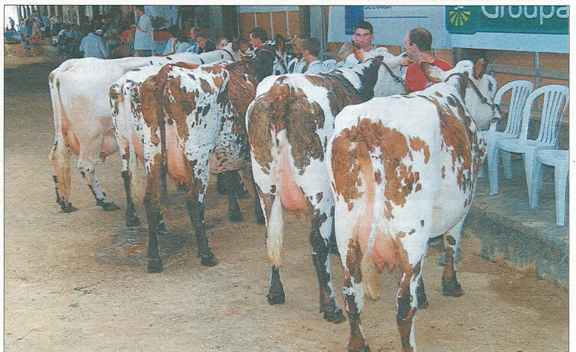
Tout au long de la journée, des présentations de laitières à hautes performances se sont déroulées, grâce notamment à l'association Normande 50.