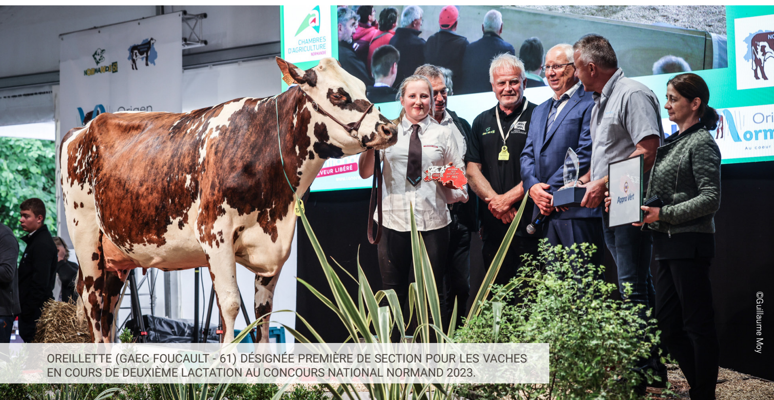
OREILLETTE (GAEC FOUCAULT - 61) DÉSIGNÉE PREMIÈRE DE SECTION POUR LES VACHES EN COURS DE DEUXIÈME LACTATION AU CONCOURS NATIONAL NORMAND 2023.

Après avoir brillé lors de cet événement organisé dans l'Orne au Haras du Pin, c'est maintenant à la capitale qu'Oreillette nous donne rendez-vous, cette fois en tant qu'égérie.