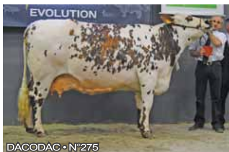
DACODAC • N°275