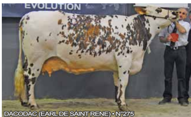
DACODAC (EARL DE SAINT RENE) • N°275