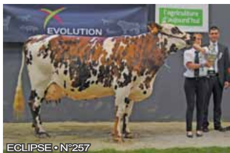
ECLIPSE • N°257