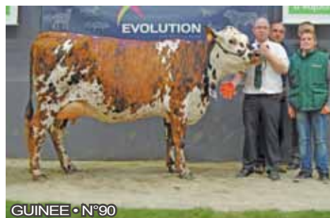
GUINEE • N°90