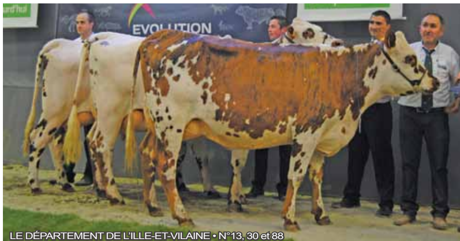
LE DÉPARTEMENT DE L'ILLE-ET-VILAINE • N°13, 30 et 88