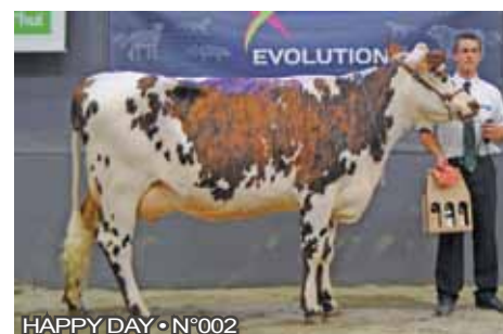
HAPPY DAY • N°002