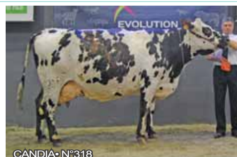
CANDIA • N°318