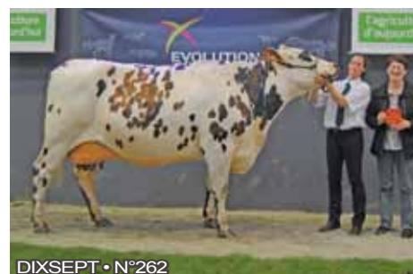
DIXSEPT • N°262