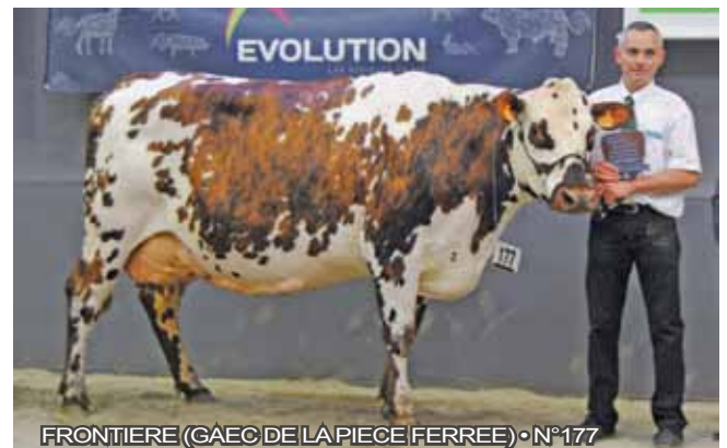
FRONTIERE (GAEC DE LA PIECE FERREE) • N°177