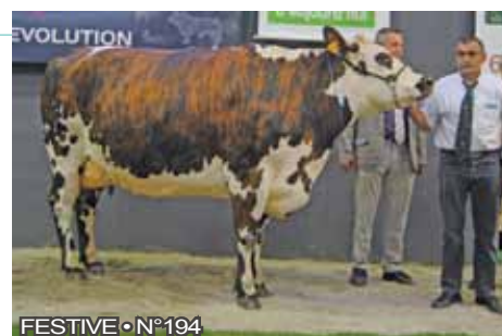
FESTIVE • N°194