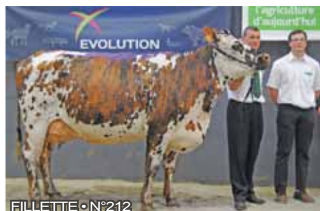
FILLETTE • N°212