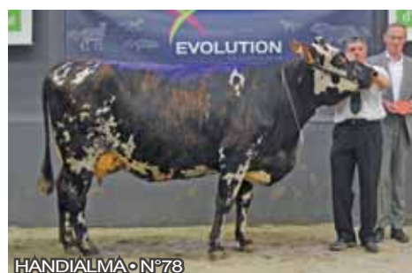
HANDIALMA • N°78