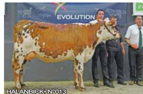
HALANBICK • N°013

Origenplus SOLUTIONS NUTRITIONNELLES POUR LES VÉTÉRAIRES