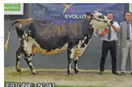
ESTONIE • N°241