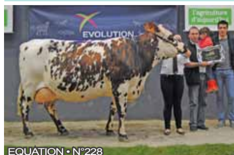
EQUATION • N°228