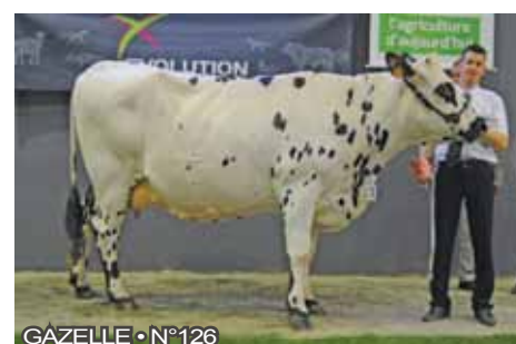
GAZELLE • N°126