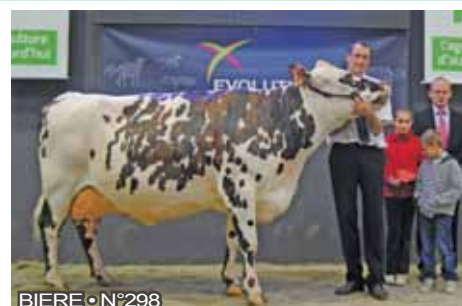
BIERE • N°298