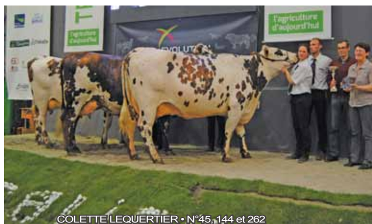
COLETTE LEQUERTIER • N°45, 144 et 262