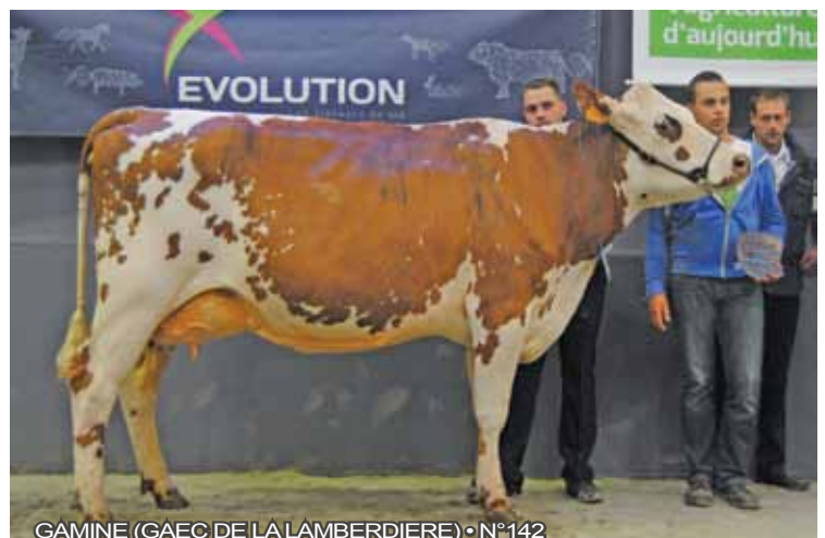
GAMINE (GAEC DE LA LAMBERDIERE) • N°142

GAMINE Alma x Orienteur GAEC DE LA LAMBERDIERE (50)