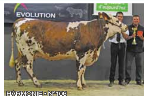
HARMONIE • N°106