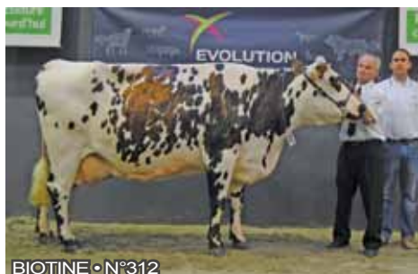
BIOTINE • N°312