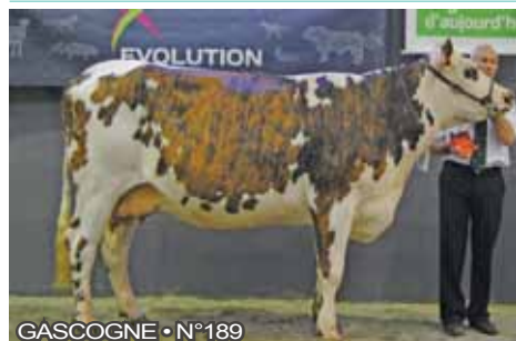
GASCOGNE • N°189