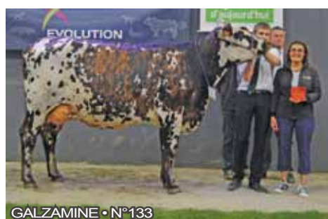
GALZAMINE • N°133