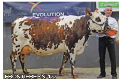
FRONTIERE • N°177