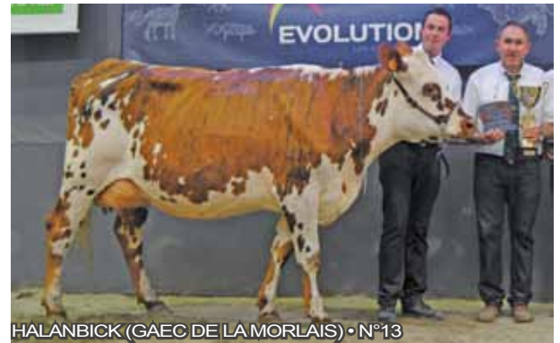
HALANBICK (GAEC DE LA MORLAIS) • N°13