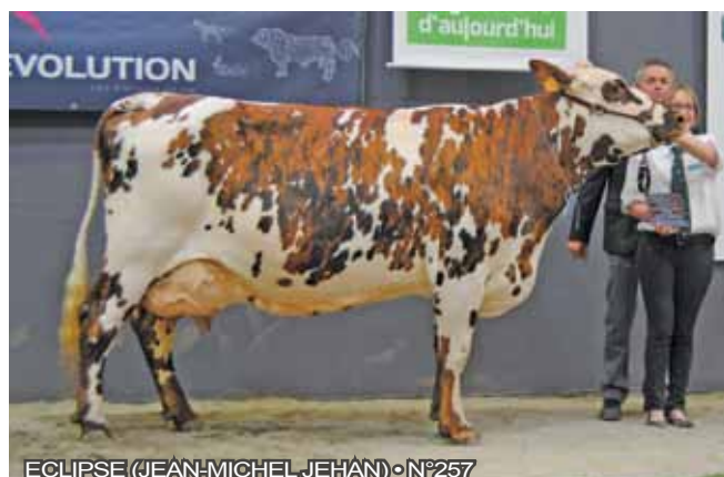
ECLIPSE (JEAN-MICHEL JEHAN) • N°257