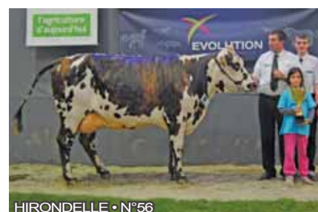
HIRONDELLE • N°56