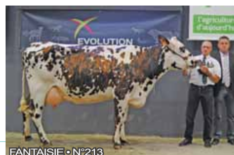
FANTAISIE • N°213