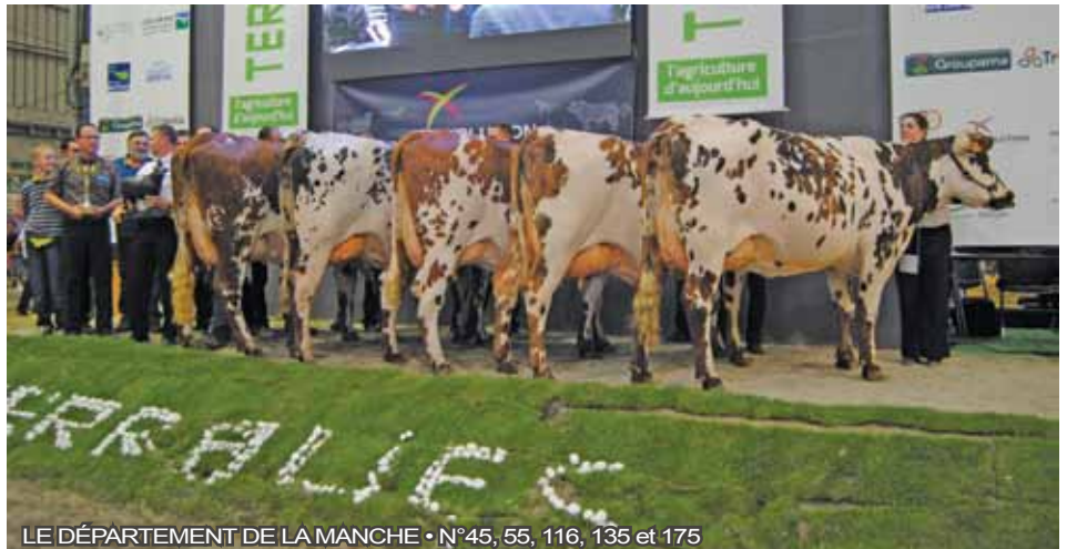
LE DÉPARTEMENT DE LA MANCHE • N°45, 55, 116, 135 et 175