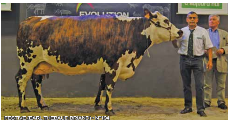
FESTIVE (EARL THEBAUD BRIAND) • N°194