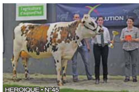
HEROIQUE • N°45