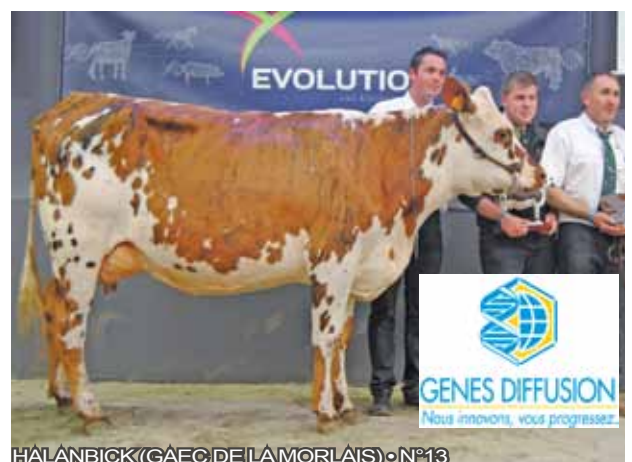
HALANBICK (GAEC DE LA MORLAIS) • N°13

HALANBICK Uvray x Rouky GAEC DE LA MORLAIS (35)